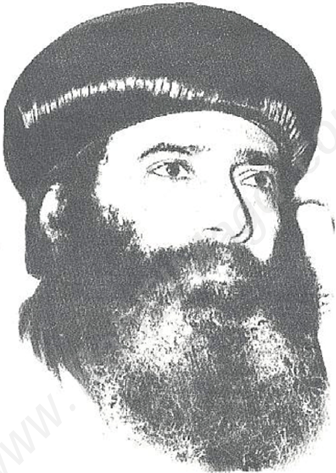
عمارة ماكين والفنكس والغفر البابا شنودة الثالث بابا الإسكندرية ويطس يسوع الكرازة الرئيسة